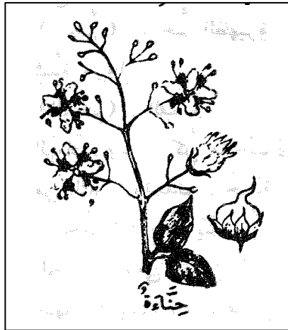
Rajah 1: Ilustrasi pohon inai dalam kamus.

Berkaitan al-Katam , al-Fayyumi mengatakan bahawa dalam kitab al-Lisan dan kitab-kitab perubatan, al-Katam (الكَتَمُ) merupakan satu jenis tanaman gunung yang terdapat di daerah Yaman. Ia mengeluarkan warna hitam seakan-akan kemerahan. 8 Disebutkan di dalam kitab 'Awn al-Ma'bud , mewarnakan rambut dan janggut ( khadab ) dengan gabungan kedua-duanya (inai dan katam) akan mengeluarkan warna di antara hitam dan merah. Inilah yang menjadi amalan Abu Bakar yang sering melakukan khadab dengan gabungan inai dan katam sepertimana hadis: 9