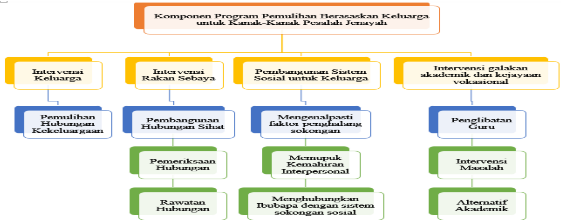
Rajah 2: Komponen Program Pemulihan Berasaskan Keluarga untuk Kanak-Kanak Pesalah Jenayah