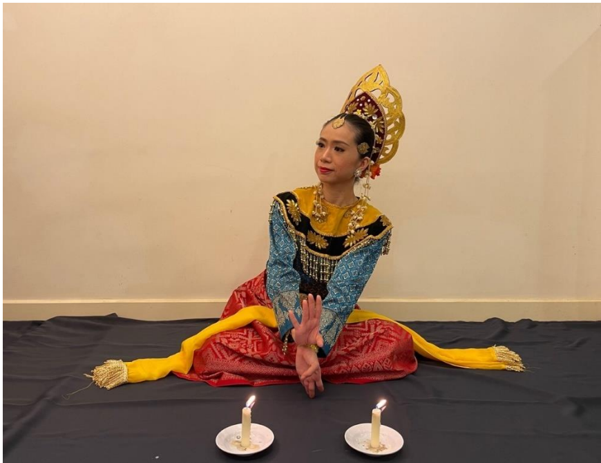
Rajah 6: Gerak Pasak Bumi Terinai

Penari pertama mengambil piring yang berisi tujuh lilin menggunakan tangan kiri atau kanan. Pada awalnya, sebelah tangan memegang piring yang dilambung seperti pergerakan ombak ke atas dan ke bawah sahaja, manakala tangan yang tidak memegang piring membuat motif pergerakan silat atau hanya sekadar lambungan. Motif pergerakan silat ini dilakukan dengan tangan digulungkan menghampiri badan dan dibuka telapak tangan menghadap ke hadapan. Pergerakan diteruskan dengan membawa tangan seperti menyauk ke belakang lalu ditarik semula ke hadapan dada, digulungkan dan dimatikan dengan menghala telapak tangan ke hadapan. Penari diberikan kebebasan untuk bermain dengan cara menukarkan piring ke sebelah tangan kanan atau kiri dan membuat pergerakan gulungan tarian piring seperti lakaran nombor lapan. Penari sentiasa mengekalkan kedudukan lilin yang tegak di dalam piring, dan membawa piring ke belakang badan melalui laluan mendekati dengan pinggul, lalu dibawa ke tepi, ke atas dan sampai semula di hadapan dada. Pergerakan yang dilakukan oleh penari tidak mementingkan kesamaan malahan perkara yang ditegaskan dalam segmen ini adalah sifat sendiri