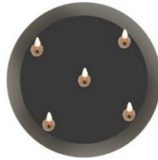
Rajah 3: Piring Tembaga Terinai Lima Lilin (Pandangan atas)