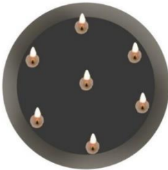
Rajah 4: Piring Tembaga Terinai Tujuh Lilin (Pandangan atas)