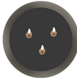
Rajah 5: Piring Tembaga Terinai Tiga Lilin (Pandangan atas)